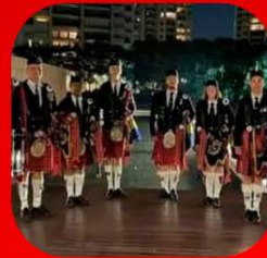
Brazilian Piper Gaitas Escocesas