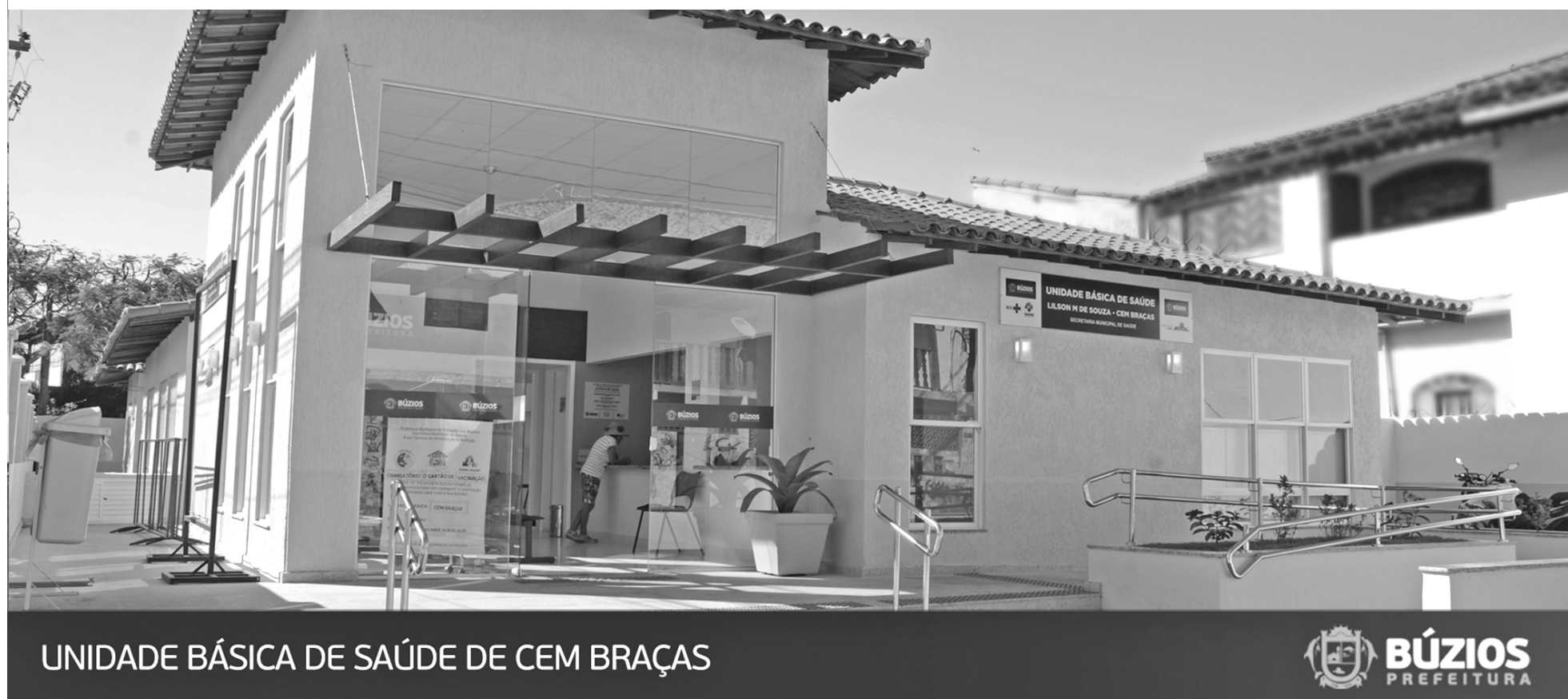
UNIDADE BÁSICA DE SAÚDE DE CEM BRAÇAS