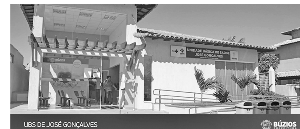
UBS DE JOSÉ GONÇALVES