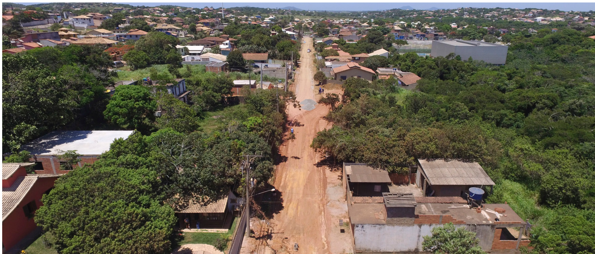
PAVIMENTAÇÃO E DRENAGEM DA RUA CASTORINA NO BAIRRO CRUZEIRO